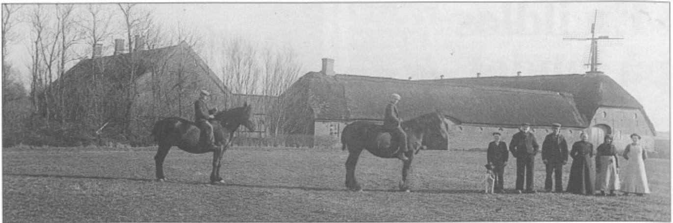
På marken vest for Frederiksborg-gård 1909.